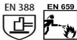
Figura Ilustrativa 1

3.1.2. A luva deverá possuir em sua grade os tamanhos 7, 8, 9, 10, 11 e 12; a medida deverá ser feita seguindo o padrão internacional de medidas para luvas conforme Figura Ilustrativa 02 e Tabela 1.